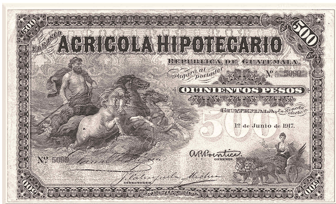
Figura 3. Billeto de 500 pesos del Banco Agrícola Hipotecario (1917)

Nota: con dimensiones aproximadas de 130×212 mm, el billete de 500 pesos del Banco Agrícola Hipotecario constituye la denominación más alta y el formato de mayor tamaño físico documentado en Guatemala antes de la creación del Banco Central. Su escala lo distingue dentro del corpus por sus características materiales y técnicas de impresión.