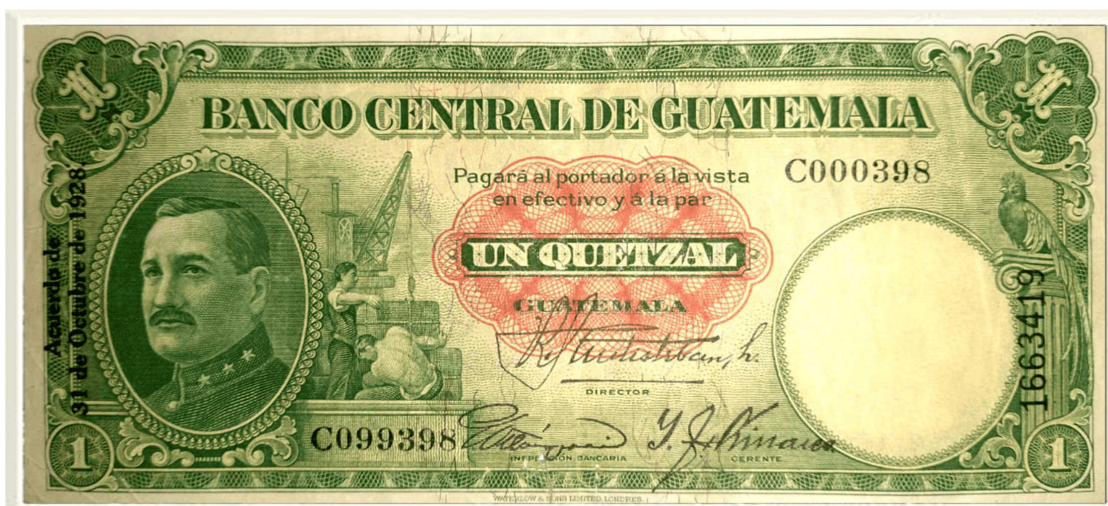
Figura 4. Billeto de un quetzal del Banco Central de Guatemala (1928)

Nota: Primer billete emitido bajo la denominación del quetzal por el Banco Central de Guatemala. Representa la transición hacia un régimen de emisión centralizado previo a la creación del Banco de Guatemala en 1945.