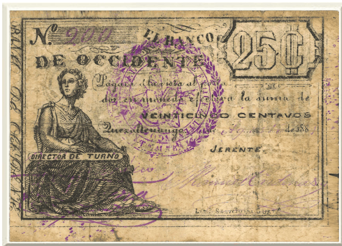
Figura 2. Billeto de 25 centavos del Banco de Occidente (1881)

Nota: impreso en Guatemala sobre papel de baja calidad, su nivel de deterioro sugiere una circulación intensiva. En las colecciones y catálogos consultados no se identificaron otros ejemplares de esta denominación, aunque no puede descartarse la existencia de piezas adicionales no registradas.