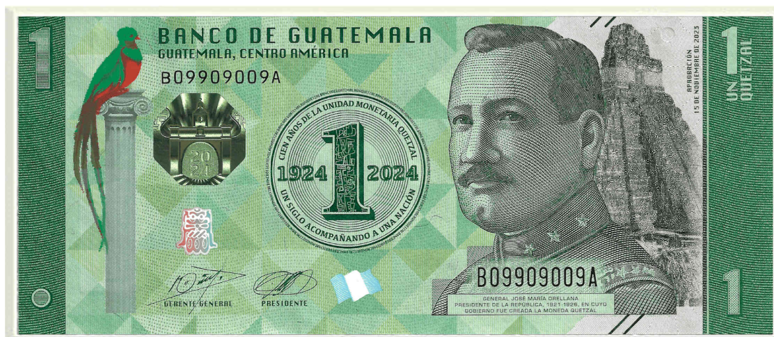
Figura 5. Billeto de un quetzal, Banco de Guatemala (2023)