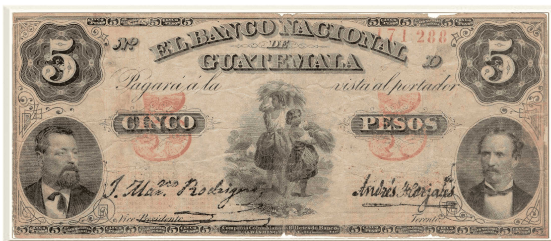
Figura 1. Billeto de cinco pesos del Banco Nacional de Guatemala (1874)

Nota: primera emisión oficial de papel moneda en Guatemala, impresa en Estados Unidos por la American Bank Note Company. Representa el inicio de la era bancaria y de billetes en el país tras la escasez de metales preciosos derivada de los conflictos por la disolución de la Federación Centroamericana.